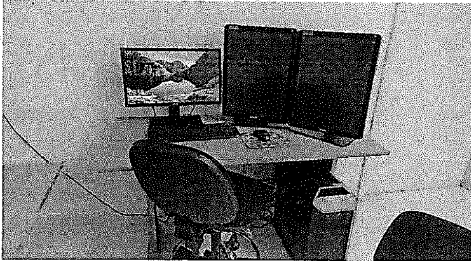
EQUIPO DE INTERPRETACION PARA MEDICO RADIOLOGO