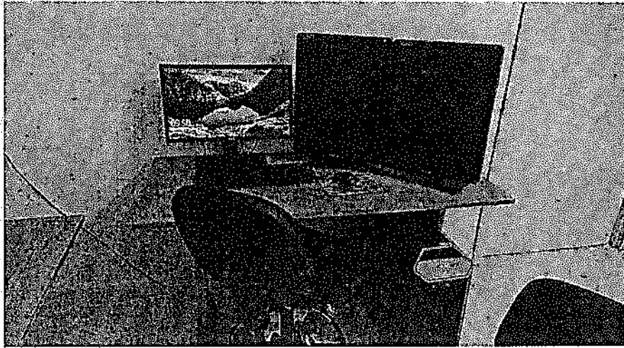
EQUIPO DE INTERPRETACION PARA MEDICO RADIOLOGO